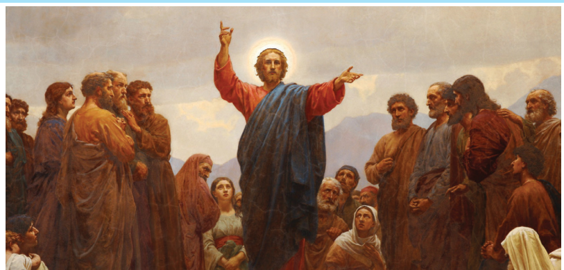
Մեր Տէրը Յիսուս Քրիստոս կը խոստանայ.-

• Մեր Երկնաւոր Հայրը մեզմէ կ'ակնկալէ, որ այնպէս ինչպէս մենք հետամուտ ենք երկրաւոր բարիք, հարստութիւն և երջանկութիւն ապահովելու, նոյնքան և աւելի խոհեմութիւն, ճիգ, հնարք և աշխատանք տանինք հոգևոր շնորհք վաստակելու համար՝ արժանանալով երկնային անսպառ գանձերը տնտեսելու պաշտօնին և արքայութեան մէջ յաւիտենական կեանքը ժառանգելու հնարաւորութեան: